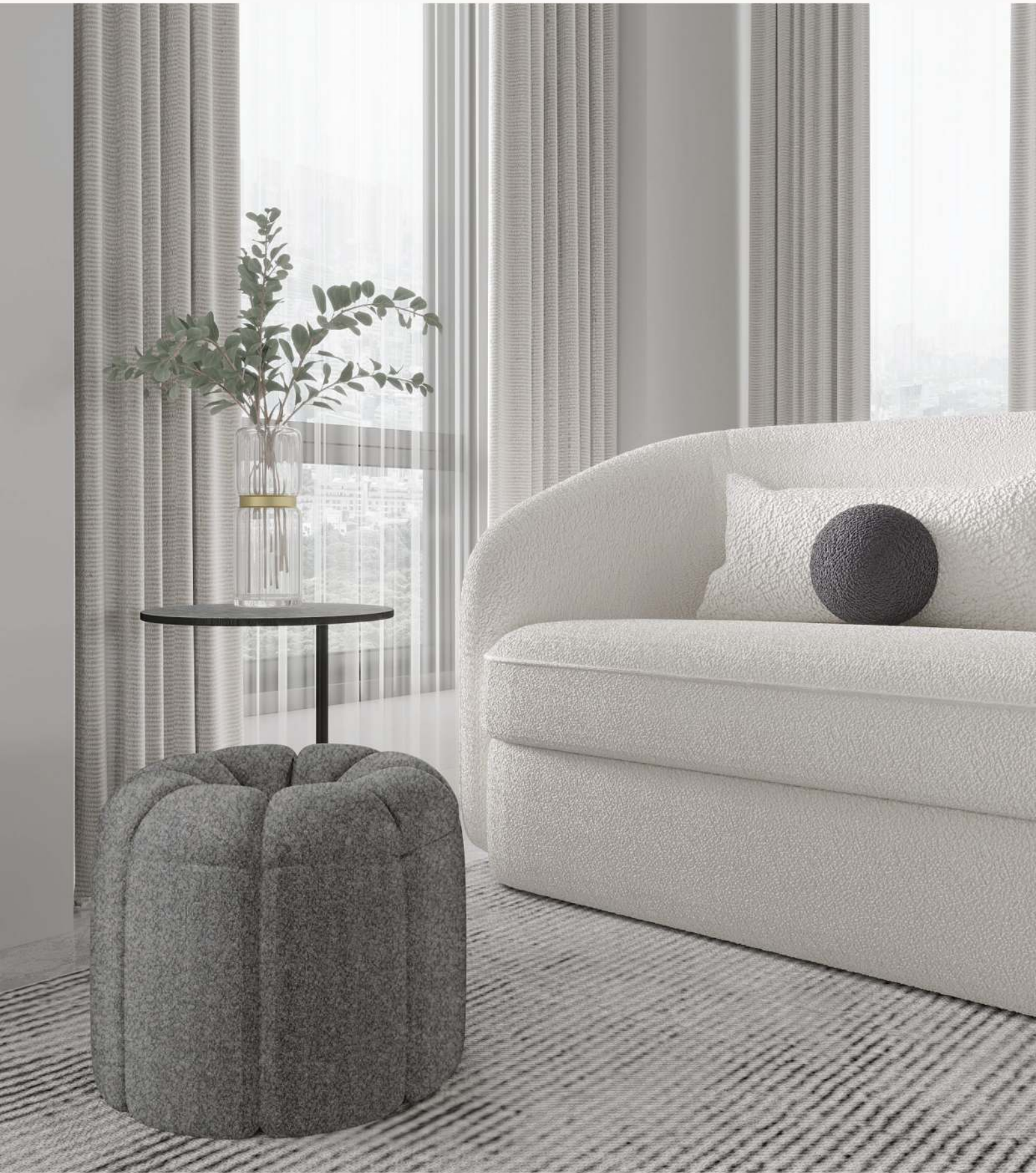
أريكة بوكليه فخمة بتصميم ناعم luxurious boucle sofa with a soft design